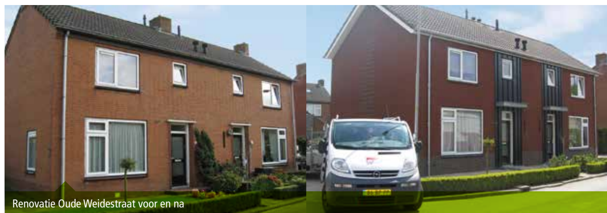
Renovatie Oude Weidestraat voor en na

Kortom, de woningen kunnen weer jaren lang mee. De woningen aan De Ouwelsestraat en Oude Weidestraat zijn inmiddels klaar. En nu is de Jan van Steenbergestraat aan de beurt. Hier ronden we de werkzaamheden in november 2015 af.