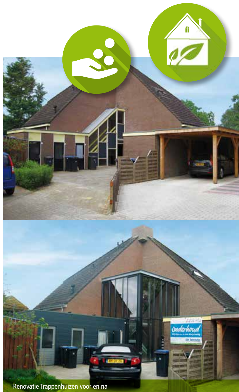
Renovatie Trappenhuizen voor en na