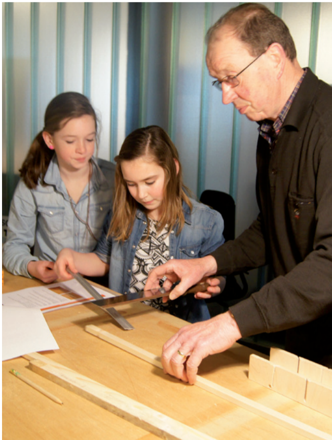
'HET TECH-LOKAAL ONDERSTEUND VANUIT "GELD VOOR ONZE BUURT"'

Aanvragen tot € 2.000 beoordeelt De Kernen binnen 4 tot 6 weken. Aanvragen boven dit bedrag beoordeelt een onafhankelijke commissie 'Geld voor onze Buurt'. Dit gebeurt ca. 4 keer per jaar. Kijk op www.dekernen.nl om mee te doen!