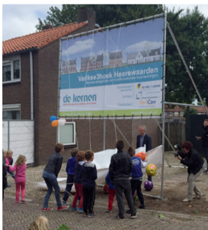
Kinderen uit de Varikse3hoek in Heerewaarden onthulden afgelopen zomer het bouwbord tijdens de officiële start van het herstructureringsproject.

Afgelopen zomer zijn de eerste woningen aan de Bukestraat in Heerewaarden gesloopt. Zaterdag 7 november hebben we een opruimdag gehouden samen met de bewoners en inmiddels zijn ook de eerste woningen in de Variksestraat gesloopt. Het herstructureringsproject Varikse3hoek, de entree van het dorp, krijgt straks prachtige nieuwe huurwoningen.