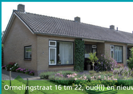
Ormelingsstraat 16 t/m 22, oud(l) en nieuw