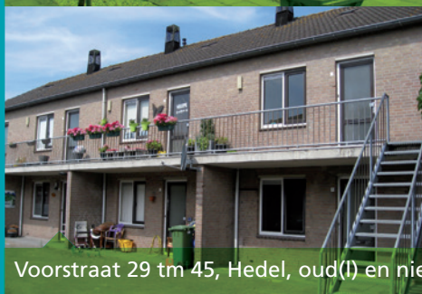
Voorstraat 29 t/m 45, Hedel, oud(l) en nieuw