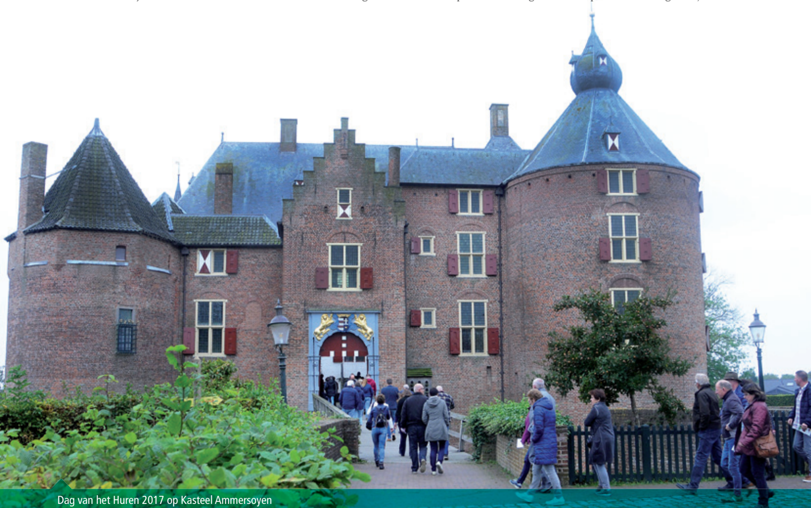
Dag van het Huren 2017 op Kasteel Ammersoyen

ook aan minder tevreden te zijn over de groenvoorziening en het parkeren in de buurt. Ook gaf een aantal mensen aan behoefte te hebben aan winkels en/of andere voorzieningen in het dorp. De gemiddelde leeftijd van degenen die de enquête hebben ingevuld, is 67.