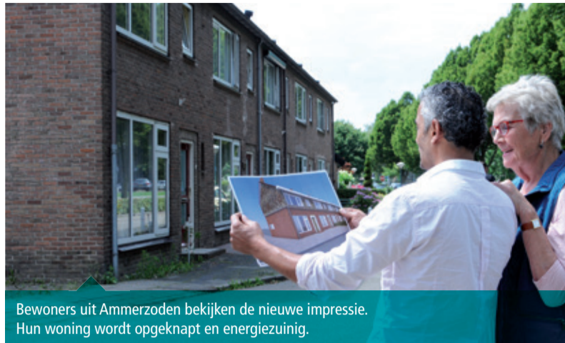
Bewoners uit Ammerzoden bekijken de nieuwe impressie. Hun woning wordt opgeknapt en energiezuinig.

Comfortabel en fijn wonen in een betaalbaar huis. Daar zet De Kernen fors op in. Door te investeren in het isoleren en opwaarderen van woningen en bewoners bewust te maken van het energiedrag. Ook zijn we in 2016 gestart met het leggen van zonnepanelen op 3.000 huurwoningen. Want minder energieverbruik, verlaagt uw energierekening en dit merkt u direct in uw portemonnee.