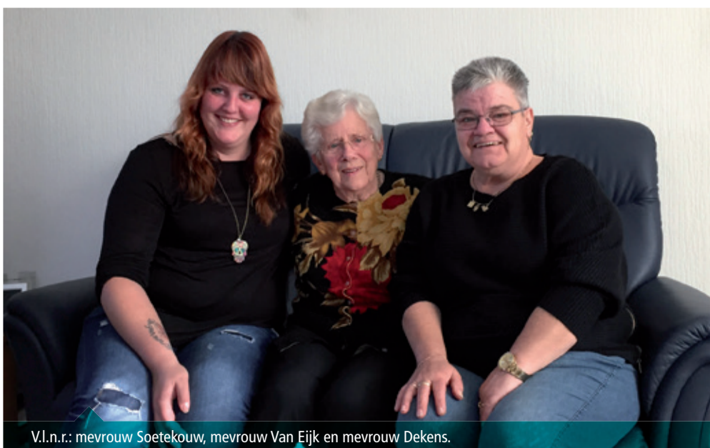
V.l.n.r.: mevrouw Soetekouw, mevrouw Van Eijk en mevrouw Dekens.

Pit is op de koffie in de Wielstraat en treft een betrokken buurt.