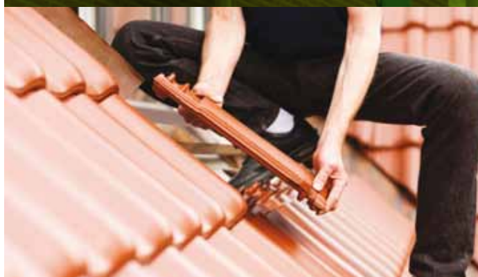
gevel-dak onderhoud: 413