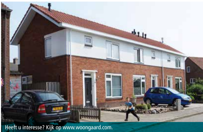
Heeft u interesse? Kijk op www.woongaard.com .