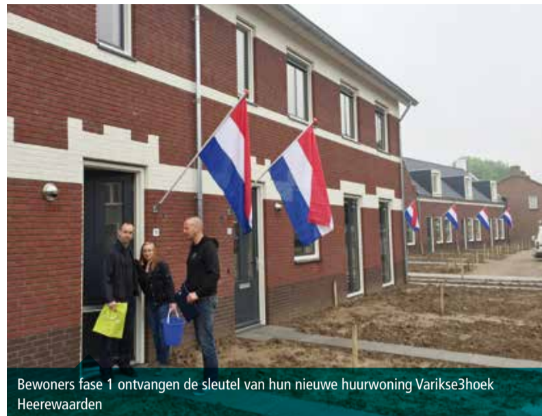
Bewoners fase 1 ontvangen de sleutel van hun nieuwe huurwoning Varikse3hoek Heerewaarden

Er zijn nog enkele woningtypen in fase 2 en 3 over voor de vrije verhuur. Deze worden geadverteerd via www.woongaard.com . Heeft u interesse? Laat het ons weten.